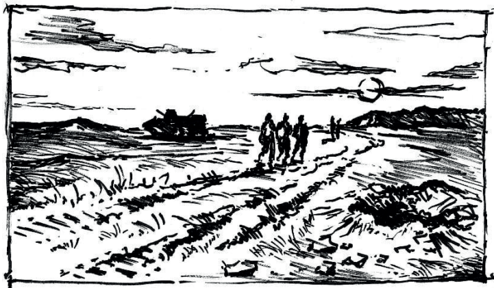
« НА МАРШЕ »